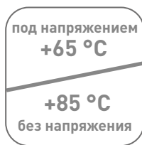
Максимальная допустимая температура